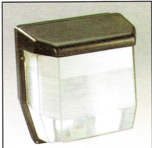
G-0640 W/ DIE-CAST ALUMINIUM BODY 鑄鋁殼